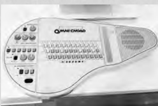
▲購入したのはOM-84。音色が本当にきれいなので、ぜひYouTubeで調べて聴いてみてほしい。

に専用のケースに入っているはいたんだけれど、「ガレージの奥底からさつき出してきました！(ドヤア)」と言わんばかりの砂埃と謎の糸(たぶんクモ?)まみれ。だいぶデロデロな状態のケースだったので、まずフタを開けるまでにだいふ意を決せねばならず：。(ほら、フタ開けて虫とか出てきたら嫌じゃないですか！)