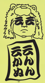
五丁目ラジオ パーソナリティ あらいごう