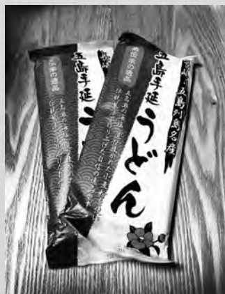
▲パッケージには、(例)長崎五島うどんがある新上五島町の町の花木「椿(つばき)」が配されている。

麺を噛んだ感じが抜群で、小麦の風味が心地良く、まろやかだけども強めの塩味はうまいとしか言いようがない。喉越しも絶品だ。ラーメンのつけ麺ファンが最も喜ぶうどんだろう。