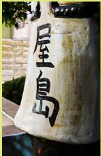
▲屋島と書かれた大福帳。トート バッグではない。

ウイキペディアには「伝説や民 俗学に関する文献類では、「屋島 の禿狸」と表記され、」とありま すがこれについてはまた次回。